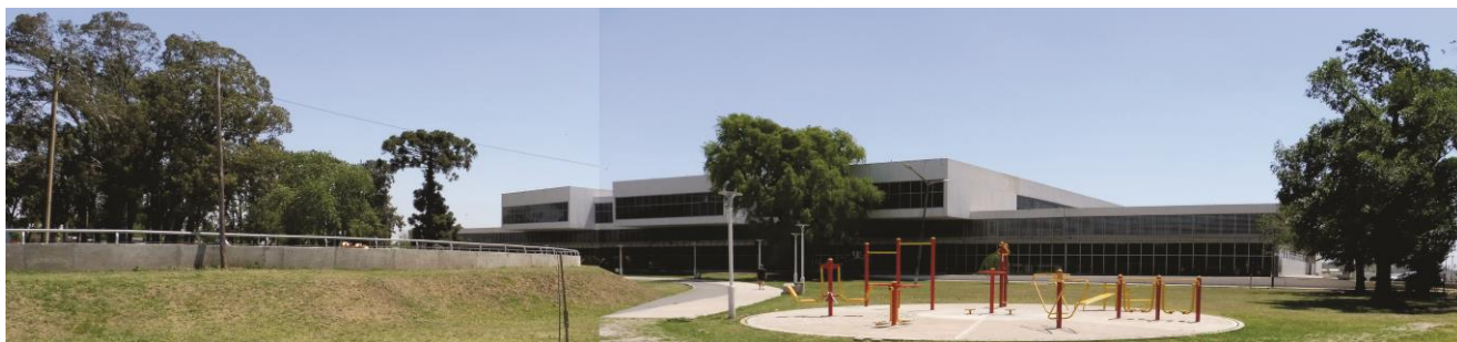
Parque Venado Tuerto y nuevo Hospital al fondo

De este modo el Parque se constituye como centro recreativo que disfruta tanto la comunidad local como los turistas y vecinos de la región.