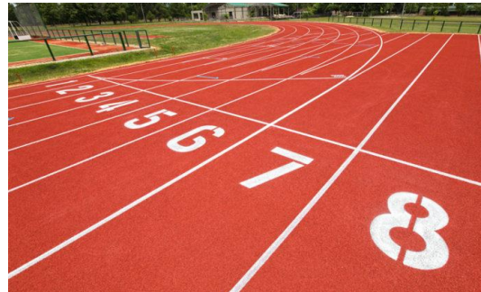
Nueva Pista de Atletismo, Clase 2, Simple Radio, 400m de longitud, con 6 carriles y recta principal de 8 carriles

La construcción de la pista de atletismo permitirá que el Parque de Venado Tuerto sea un centro de desarrollo atlético para su ciudad y su zona, albergando competencias regulares federativas, los juegos santafesinos y competencias nacionales y eventualmente internacionales. Este hecho demanda la necesidad de que las instalaciones cuenten con un local adecuado para que funcione como Oficina de Control de Torneos, un Depósito apropiado para el guardado seguro del equipamiento básico de competencia, y un núcleo sanitario de apoyo. Por esas razones se incluyó en la presente licitación la construcción de un edificio módulo de oficina y un edificio módulo de depósito; incluyendo las obras de terminación del Núcleo de Sanitarios Públicos con Torre Tanque elevado que quedó inconcluso en la obra de "Puesta en valor y construcción de nueva infraestructura Deportiva y urbana - Parque Balneario Municipal" ejecutada en el año 2019 por el gobierno provincial. Este núcleo sanitario de apoyo, servirá a distintos deportes que se desarrollan en el predio, incluye sanitarios y vestuarios con instalación de un sistema de aprovechamiento de energía solar para el calentamiento de agua para uso de las duchas de los vestuarios.