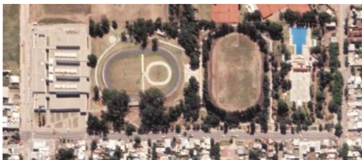
Imagen Aérea Actual del Predio del Parque