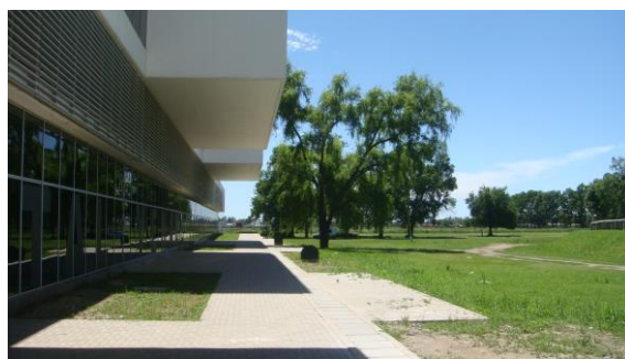
Vista Nuevo Hospital Venado Tuerto desde el parque

Actualmente, el Parque cuenta con una pista de atletismo que data de la década del 70, con carriles de tierra, y algunos sectores con solado sintético in situ muy deteriorado. El diseño y estado de la pista actual no ofrece condiciones de seguridad a los atletas, sino que solo es utilizada para actividades de entrenamiento. La pista se encuentra obsoleta tanto por sus características técnicas como constructivas, presentando problemas de drenaje